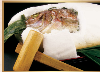
鯛塩釜焼き 〈大〉 6,000円 〈小〉 1,300円