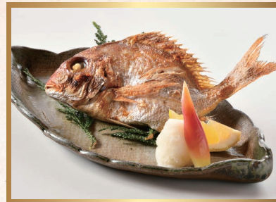
鯛塩焼き 〈大〉 6,000円 〈小〉 1,300円