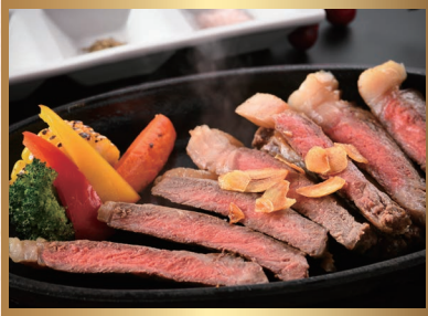
和牛 ステーキ (150g) 4,500円