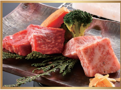
若狭牛 サイコロ ステーキ (90g) 3,000円