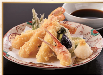
◆冬季限定 蟹天麩羅 2,400円