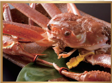
◆冬季限定 越前蟹〈時価〉